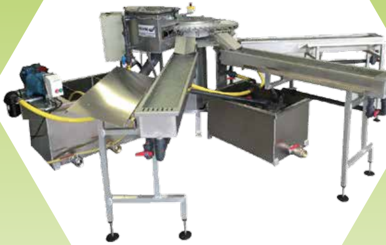
Bacs en eau